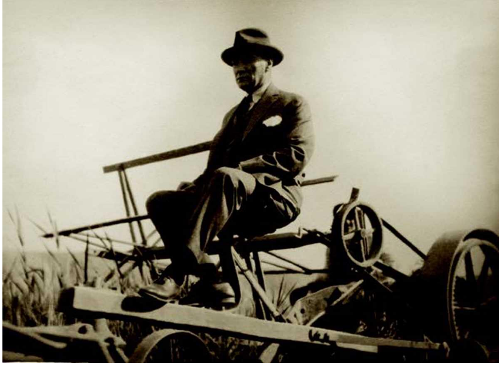
Gazi Orman Çiftliği, Ankara, 1929

Bütün hayatı mücadele içinde geçen Atatürk'ün 1937 yılının sonlarına doğru sağlığı bozulmaya başladı. Buna rağmen o dönemde yoğun bir biçimde bitmeyen bir heyecanla Hatay'ın ana vatana dâhil olması için çalıştı. Kendisinde mevcut karaciğer yetmezliği Ocak 1938'de daha da belirginleşti. Büyük Önder son günlerini İstanbul'da sürekli doktorların gözetiminde geçirdi. 10 Kasım 1938 Perşembe günü saat dokuzu beş geçte Dolmabahçe Sarayı'nda hayata gözlerini kapadı. Ölümü bütün dünyada derin akisler yaptı ve büyük üzüntü yarattı.