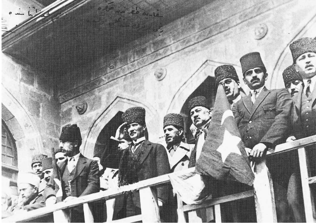
TBMM'nin balkonundan halkı selamlarken, Ankara, 1922

Soyadı Kanunu gereğince, 24 Kasım 1934'de Türkiye Büyük Millet Meclisi tarafından Mustafa Kemal'e "Atatürk" soyadı verildi. Mustafa Kemal, 24 Nisan 1920 ve 13 Ağustos 1923 tarihlerinde TBMM Başkanlığına seçildi. Bu başkanlık görevi, devlet-hükümet başkanlığı düzeyindeydi. 29 Ekim 1923 yılında Cumhuriyet ilan edildi ve Atatürk ilk cumhurbaşkanı seçildi. Anayasa gereğince dört yılda bir cumhurbaşkanlığı seçimleri yenilendi. 1927, 1931, 1935 yıllarında TBMM Atatürk'ü yeniden cumhurbaşkanlığına seçti.