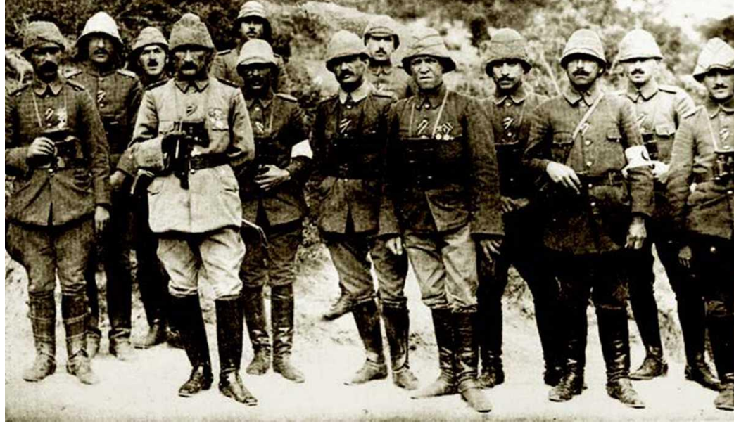
Gelibolu, Çanakkale, 1915

18 Mart 1915'te Çanakkale Boğazı'nı geçmeye kalkan İngiliz ve Fransız donanması ağır kayıplar verince Gelibolu Yarımadası'na asker çıkarmaya karar verildi. 25 Nisan 1915'te Arıburnu'na çıkan düşman kuvvetlerini, Mustafa Kemal'in komuta ettiği 19. Tümen Conkbayırı'nda durdurdu. Mustafa Kemal, bu başarı üzerine albaylığa yükseldi. İngilizler 6-7 Ağustos 1915'te Arıburnu'nda tekrar taarruza geçti. Anafartalar Grubu Komutanı Mustafa Kemal 9-10 Ağustos'ta Anafartalar Zaferi'ni kazandı. Bu zaferi 17 Ağustos'ta Kireçtepe, 21 Ağustos'ta ikinci Anafartalar zaferleri takip etti. Mustafa Kemal'in askerlerine "Ben size taarruzu emretmiyorum, ölmeyi emrediyorum!" emri cephenin kaderini değiştirdi.