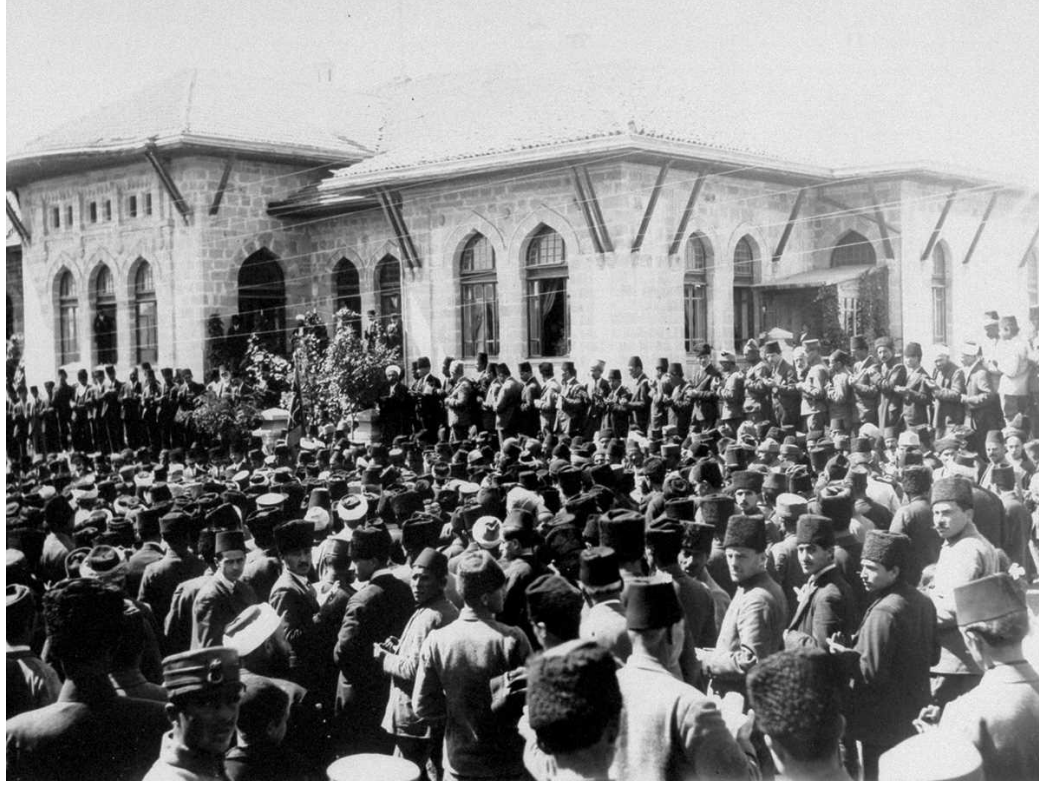
TBMM'nin açılışı, Ankara, 1920

Türk Kurtuluş Savaşı 15 Mayıs 1919'da Yunanlıların İzmir'i işgali sırasında düşmana ilk kurşunun atılmasıyla başladı. 10 Ağustos 1920 tarihinde Sevr Antlaşması'nı imzalayarak aralarında Osmanlı İmparatorluğu'nu paylaşan Birinci Dünya Savaşı'nın galip devletlerine karşı önce Kuvayı Milliye adı verilen milis kuvvetleriyle savaşıldı. Türkiye Büyük Millet Meclisi düzenli orduyu kurdu, Kuvayı Milliye ile ordunun bütünleşmesini sağlayarak savaşı zaferle sonuçlandırdı.