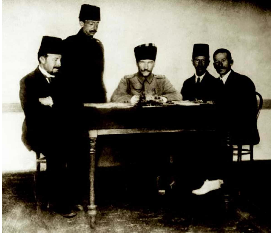
Erzurum Kongresi için hazırlıklar yapılırken, Erzurum, 1919

27 Aralık 1919'da Ankara'da heyecanla karşılandı. 23 Nisan 1920'de Türkiye Büyük Millet Meclisi'nin açılmasıyla Türkiye Cumhuriyeti'nin kurulması yolunda önemli bir adım atıldı. Meclis ve Hükümet Başkanlığına Mustafa Kemal seçildi. Türkiye Büyük Millet Meclisi, Kurtuluş Savaşı'nın başarıyla sonuçlanması için gerekli yasaları kabul edip uygulamaya başladı.