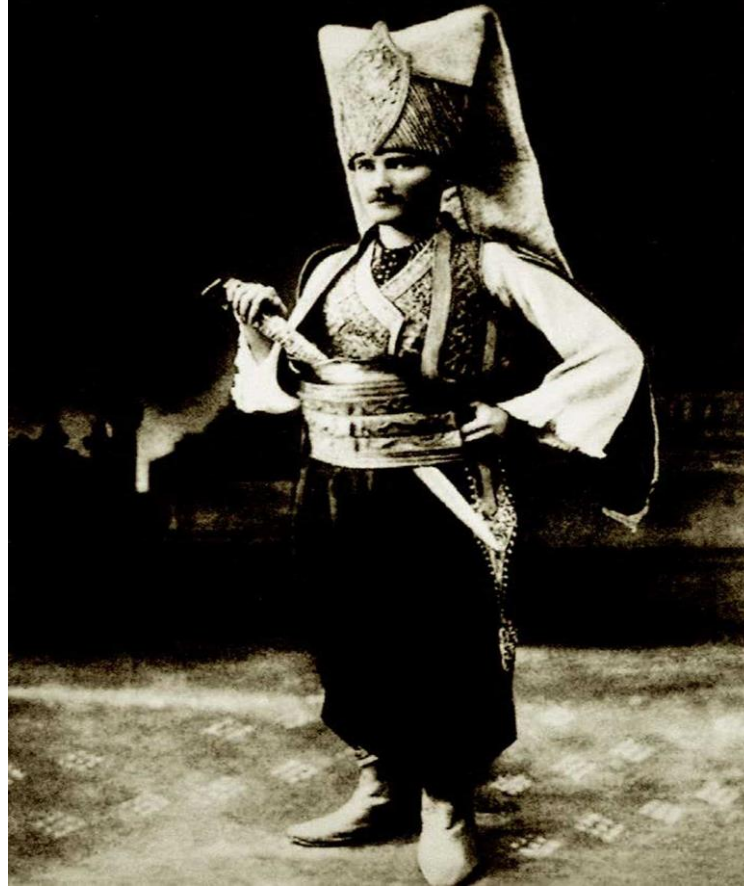
Kurmay Yarbay Mustafa Kemal, Sofya' daki baloda yeniçeri kıyafetiyle, Bulgaristan, 1914

Mustafa Kemal, Birinci Dünya Savaşı'nın başlaması üzerine kendisine aktif görev verilmesini istedi. Bunun üzerine 1915 yılı başında Esat Paşa (Bülkat) komutasındaki 3. Kolorduya bağlı olarak Tekirdağ'da kurulacak 19. Tümen Komutanlığına atandı. 1914 yılında başlayan Birinci Dünya Savaşı'nda, Çanakkale'de bir kahramanlık destanı yazıp İtilaf devletlerine "Çanakkale geçilmez!" dedirtti.