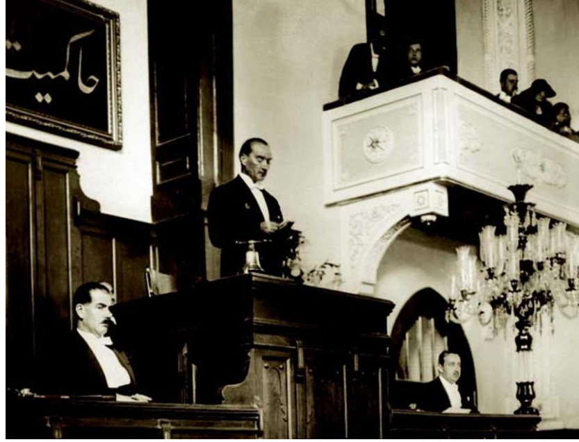
TBMM'de Nutuk'u okurken, Ankara, 1927

Atatürk özel yaşamında sadelik içinde yaşadı. 29 Ocak 1923'de Latife Hanım'la evlendi. Birçok yurt gezisine birlikte çıktılar. Bu evlilik 5 Ağustos 1925 tarihine dek sürdü. Çocukları çok seven Atatürk, Afet (İnan), Sabiha (Gökçen), Fikriye, Ülkü, Nebile, Rukiye, Zehra adlı kızları ve Mustafa adlı çobanı manevi evlat edindi. Abdurrahim ve İhsan adlı çocukları himayesine aldı.