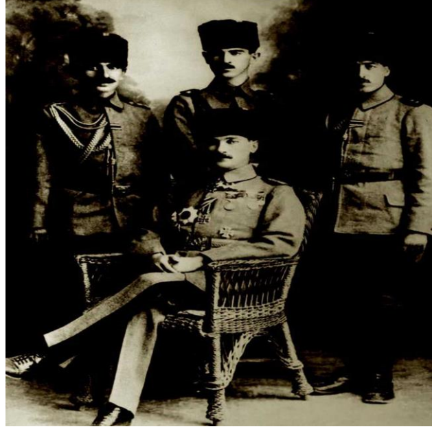
Yıldırım Orduları Grubu Komutanı Mustafa Kemal Paşa, Yaverleri Salih (Bozok), Şükrü (Tezer) ve Cevat Abbas (Gürer) Beyler ile, 1918

Bu ordunun kaldırılması üzerine 13 Kasım 1918'de İstanbul'a gelip Harbiye Nezareti'nde göreve başladı. Mondros Mütarekesi'nden sonra İtilaf devletlerinin Osmanlı ordularını işgale başlamaları üzerine Mustafa Kemal 9. Ordu Müfettişi olarak 19 Mayıs 1919'da Samsun'a çıktı. 22 Haziran 1919'da Amasya'da yayımladığı genelgeyle "Milletin istiklâlini yine milletin azim ve kararının kurtaracağını" ilan edip Sivas Kongresi'ni toplantıya çağırdı. 23 Temmuz-7 Ağustos 1919 tarihleri arasında Erzurum, 4-11 Eylül 1919 tarihleri arasında da Sivas Kongresi'ni toplayarak vatanın kurtuluşu için izlenecek yolun belirlenmesini sağladı.