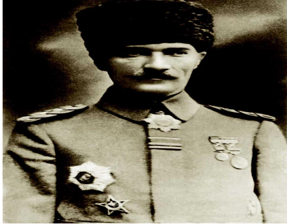
Mirliva (Tümgeneral) Mustafa Kemal, 1916

Rus kuvvetleriyle savaşarak Muş ve Bitlis'in geri alınmasını sağladı. Şam ve Halep'teki kısa süreli görevlerinden sonra 1917'de İstanbul'a geri geldi. Veliht Vahdettin Efendi'yle Almanya'ya giderek cephede incelemelerde bulundu. Bu seyahatten sonra hastalandı. Viyana ve Karisbad'a giderek tedavi oldu. 15 Ağustos 1918'de Halep'e 7. Ordu Komutanı olarak döndü. Bu cephede İngiliz kuvvetlerine karşı başarılı savunma savaşları yaptı. Mondros Mütarekesi'nin imzalanmasından bir gün sonra, 31 Ekim 1918'de Yıldırım Orduları Grubu Komutanlığına getirildi.