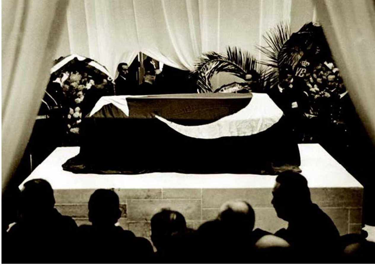
Atatürk'ün naaşı, Etnografya Müzesindeki yerine yerleştirildikten sonra, Ankara, 1938

Cenaze törenine bütün dünya devletleri özel temsilciler gönderdi. Çanakkale'de ve diğer muharebelerde ona karşı savaşmış yabancı generaller törende bilhassa dikkati çekiyordu. Atatürk'ün naaşı, 10 Kasım 1953 tarihinde yapılan büyük bir devlet töreni ile Etnografya Müzesi'ndeki geçici kabirden alınarak Anıtkabir'deki ebedî istirahatgâhına gömüldü.