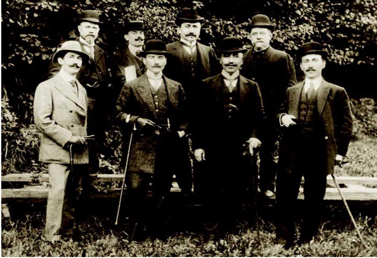
Picardie, Fransa, 1910

1911 yılında Trablusgarp Savaşı'na gönüllü olarak katıldı. Rütbesi binbaşılığa yükseltildi. Mustafa Kemal bir grup arkadaşıyla birlikte Tobruk ve Derne bölgesinde görev aldı.