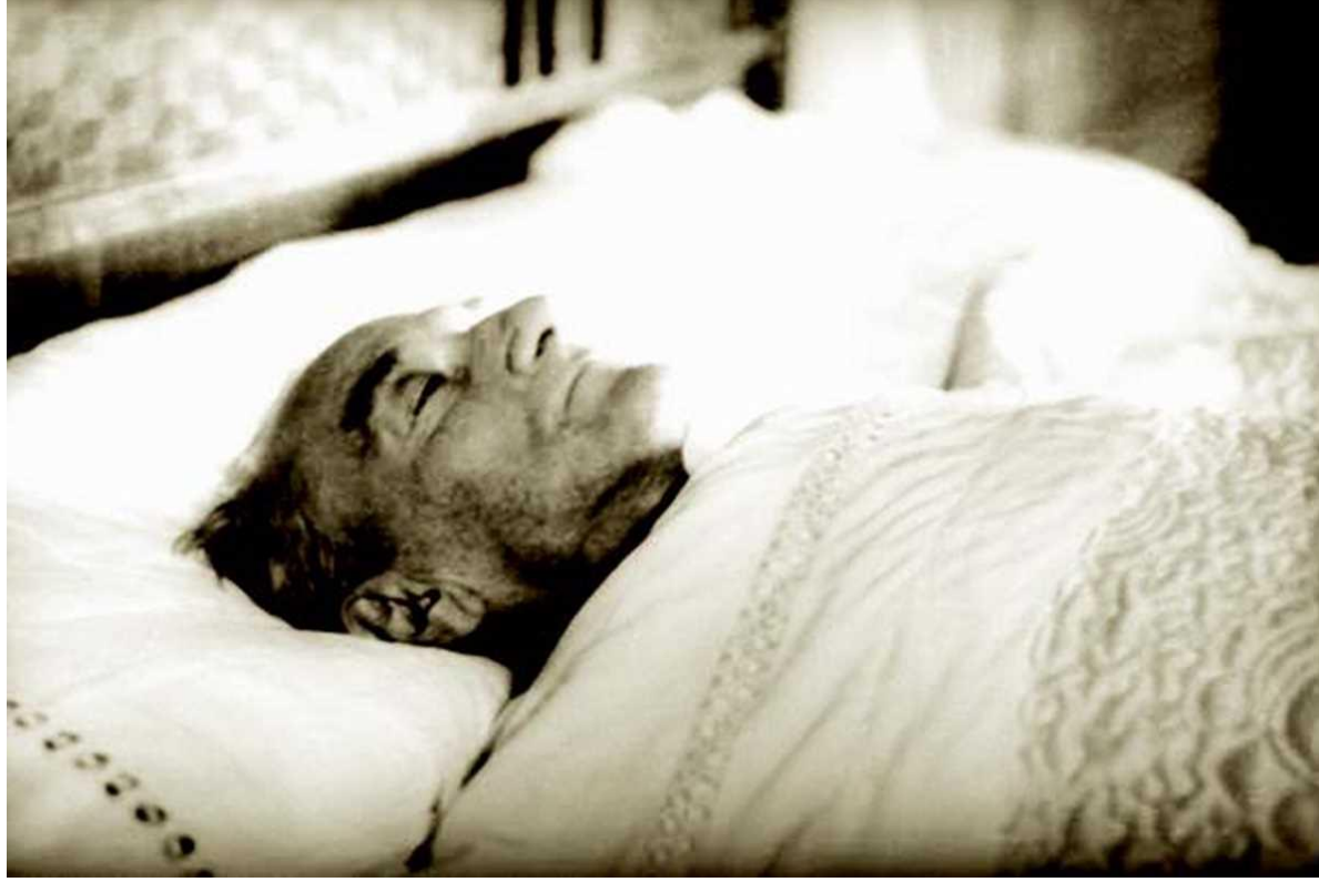
Dolmabahçe Sarayı, İstanbul, 1938

Atatürk'ün naaşı, Dolmabahçe Sarayı salonunda özel bir katafalka yerleştirildi. Türk bayrağına sarılı ve başında silâh arkadaşlarının nöbet tuttuğu mukaddes tabut, üç gün müddetle milletin ziyaretine bırakıldı.