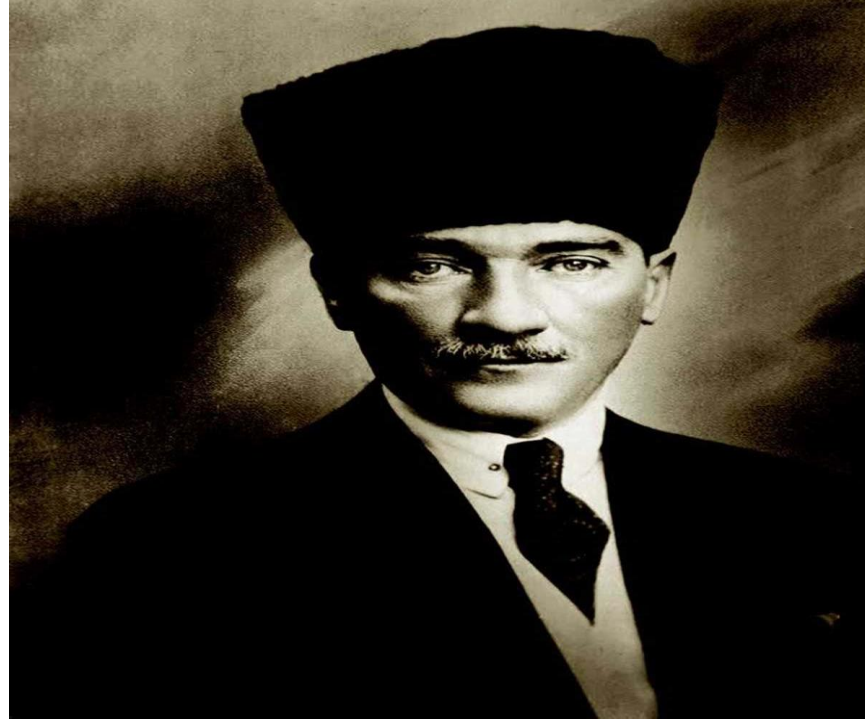
Cumhurbaşkanı Gazi Mustafa Kemal, Ankara, 1923

Atatürk sık sık yurt gezilerine çıkarak devlet çalışmalarını yerinde denetledi. İlgililere aksayan yönlerle ilgili emirler verdi. Cumhurbaşkanı sıfatıyla Türkiye'yi ziyaret eden yabancı ülke devlet başkanlarını, başbakanlarını, bakanlarını ve komutanlarını ağırladı. 15-20 Ekim 1927 tarihinde Kurtuluş Savaşı'nı ve Cumhuriyet'in kuruluşunu anlatan büyük nutkunu, 29 Ekim 1933 tarihinde de 10. Yıl Nutku'nu okudu.