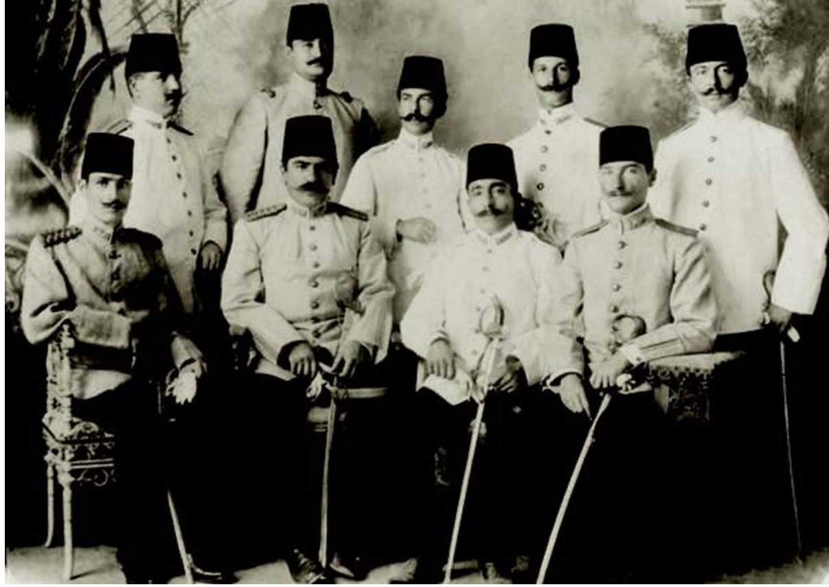
Kurmay Yüzbaşı Mustafa Kemal arkadaşları ile, Şam, 1906