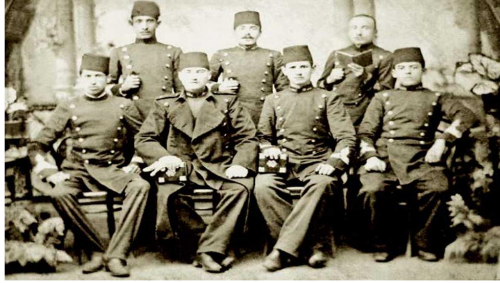
Mustafa Kemal Mekteb-i Harbiye'de, İstanbul, 1901

1903 yılında ikinci sınıfa geçerek üsteğmenliğe yükseldi. 11 Ocak 1905'te yüzbaşı rütbesiyle Harp Akademisinden mezun oldu. Mustafa Kemal, Harp Okulu ve Harp Akademisindeki öğrenciliği sırasında ülke ve millet sorunlarıyla yakından ilgilenmiş, aydın ve ileri fikirli bir subay olarak tanınmıştı. Bu nedenle Harp Akademisinden mezuniyetini takiben yönetim karşıtı fikirlerinden dolayı kısa bir süre gözaltında tutuldu. 1905 yılında Şam'daki 5. Ordu emrine atandı. Aynı yıl bazı arkadaşlarıyla birlikte, gizli olarak, Vatan ve Hürriyet Cemiyeti'ni kurdu. Bu cemiyetin Beyrut, Yafa ve Kudüs'te şubeleri açıldı.