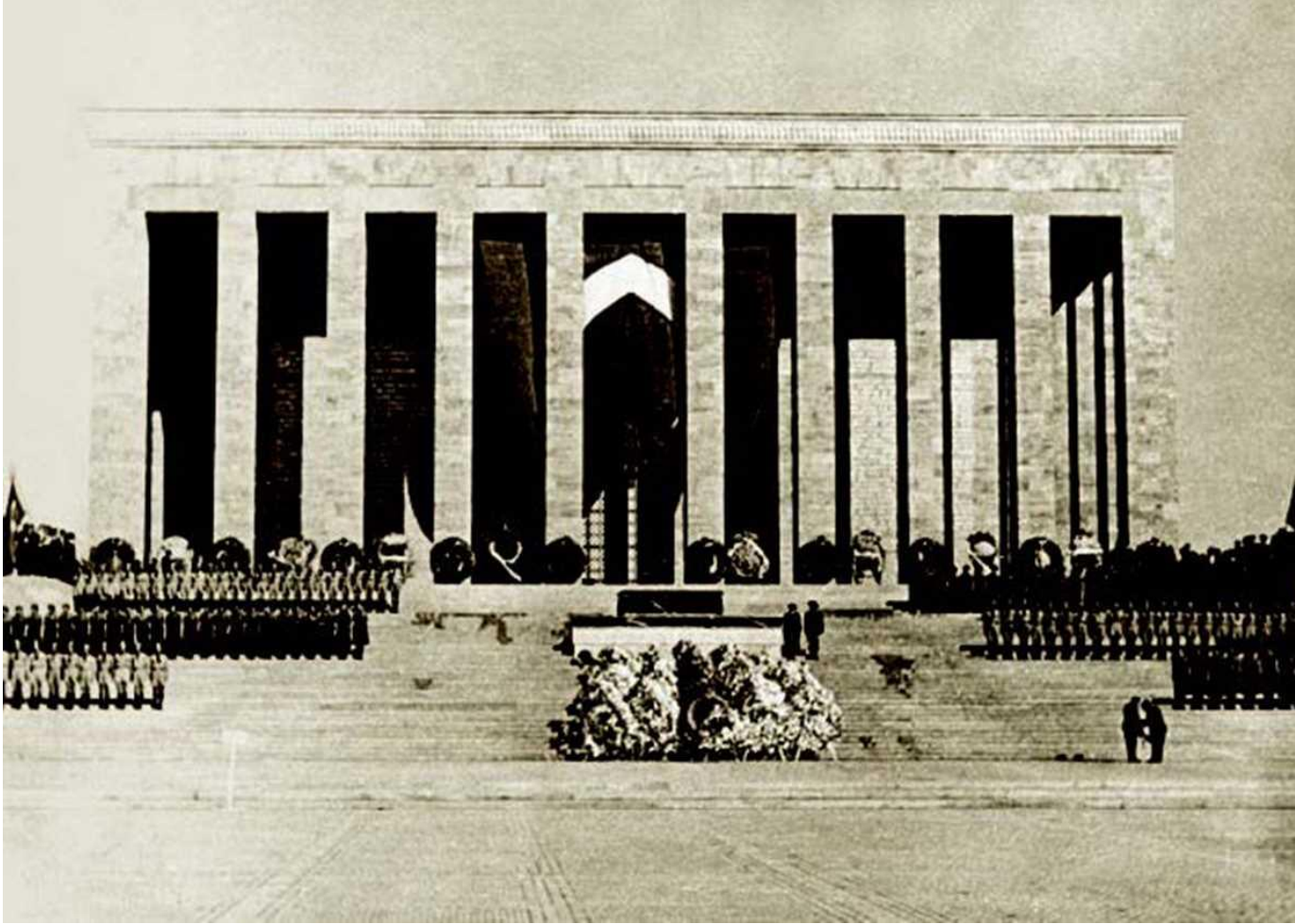
Atatürk'ün naaşı hitabet kürsüsünde, Ankara, 1953