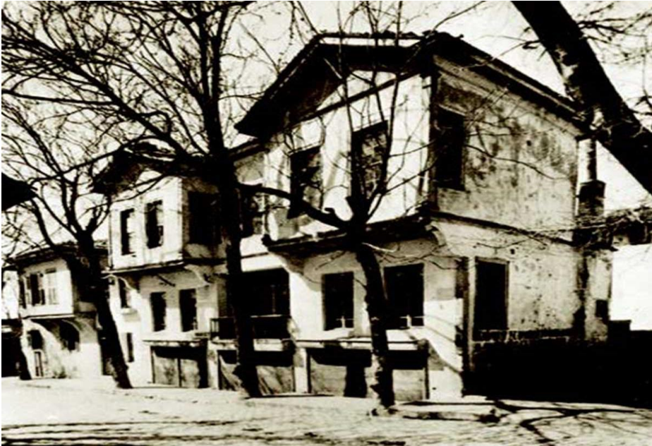
Mustafa Kemal Atatürk'ün doğduğu ev, Selanik

Mustafa Kemal Atatürk, 1881 yılında Selânik'te Kocakasım Mahallesi, Islâhhâne Caddesi'ndeki üç katlı pembe evde doğdu. Babası Ali Rıza Efendi, annesi Zübeyde Hanım'dır. Baba tarafından dedesi Hafız Ahmet Efendi, 14-15. yüzyıllarda Konya ve Aydın'dan Makedonya'ya yerleştirilmiş Kocacık Yörüklerindedir. Annesi Zübeyde Hanım ise Selânik yakınlarındaki Langaza kasabasına yerleşmiş eski bir Türk ailesinin kızıdır. Ali Rıza Efendi, 1871 yılında Zübeyde Hanım'la evlendi. Atatürk'ün beş kardeşinden dördü küçük yaşlarda öldü, sadece Makbule (Atadan) Hanım 1956 yılına değin yaşadı.