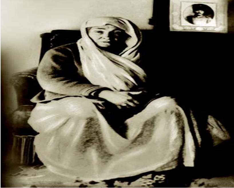
Annesi Zübeyde Hanım

Küçük Mustafa, öğrenim çağına gelince annesinin arzusu üzerine Hafız Mehmet Efendi'nin mahalle mektebinde ilköğrenimine başladı. Kısa bir süre sonra babasının isteğiyle devrinin şartlarına göre modern eğitim veren Şemsi Efendi Mektebine geçti. Bu sırada babasını kaybetti. Bir süre Rapla Çiftliği'nde dayısının yanında kaldıktan sonra Selânik'e dönüp okulunu bitirdi. Selânik Mülkiye Rüştiyesine kaydoldu ve kısa bir süre sonra, 1893 yılında, Selanik Askerî Rüştiyesine girdi. Çok sevdiği matematik dersinin öğretmeni Yüzbaşı Mustafa Efendi'den, "Kemal" adını aldı. Böylece adı "Mustafa Kemal" oldu. Selanik Askerî Rüştiyesini bitirdikten sonra 1896 yılında Manastır Askerî İdadisine başladı. Edebiyata olan ilgisi, onda gelecekteki hitabet ve yazılı anlatım ustalığının temelini oluşturdu. Manastır Askerî İdadisindeki tarih öğretmeni Kolağası Mehmet Tevfik Bey, Mustafa Kemal'in tarihe ve özellikle Türk tarihine ilgi duymasında başlıca etken oldu. 1896-1899 yıllarında Manastır Askerî İdadisini bitirip, İstanbul'da Harp Okulu'nun piyade sınıfına yazıldı. Bu okuldaki öğrenciliği sırasında arkadaşlarıyla birlikte hürriyet fikirlerini yaymak amacıyla gizli olarak el basması bir gazete çıkardı. 1902 yılında Harp Okulundan teğmen rütbesiyle mezun olarak Harp Akademisine girdi.